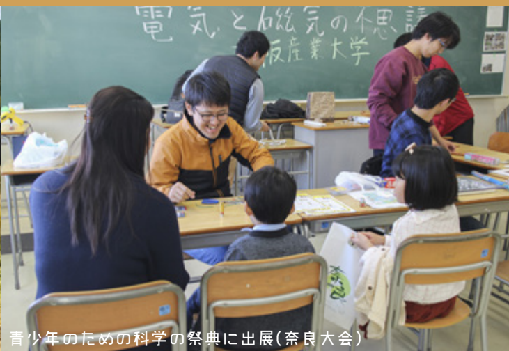
青少年のための科学の祭典に出展(奈良大会)