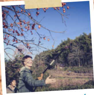
#佐藤ゼミ #田原ナチュラル・ファーム #有機農業体験