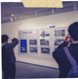
#石原ゼミ #アサヒビール吹田工場 #工場見学