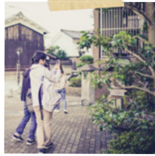
#塚本ゼミ #宇治 #歴史的建造物 #景観保全