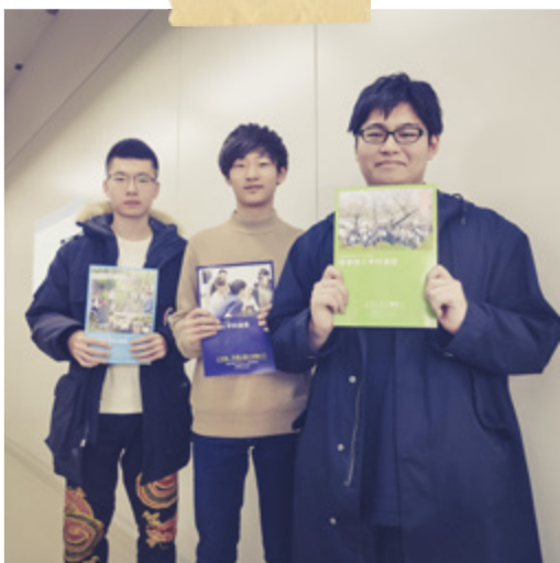
#高浪ゼミ #先生にインタビュー #学生へのアドバイス