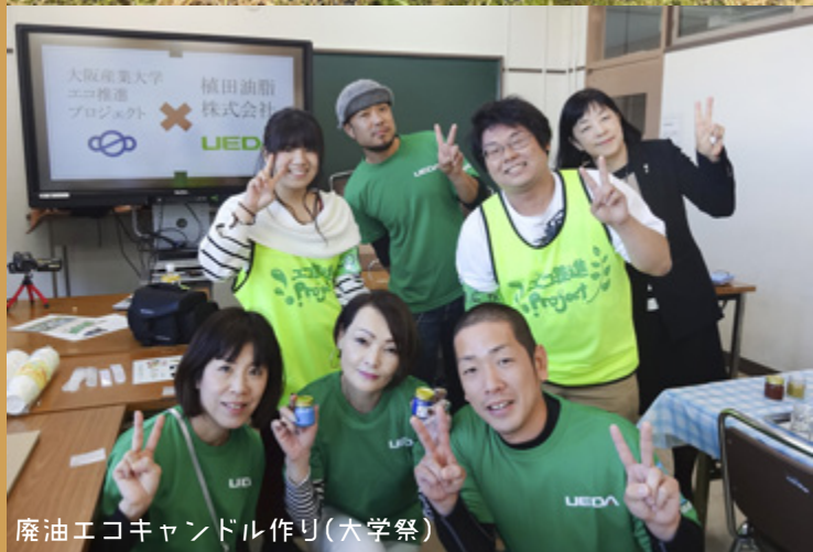
廃油エコキャンドル作り(大学祭)