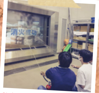
#田中ゼミ #阿倍野防災センター