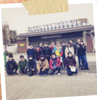
#岡田ゼミ #天王寺公園 #天王寺動物園