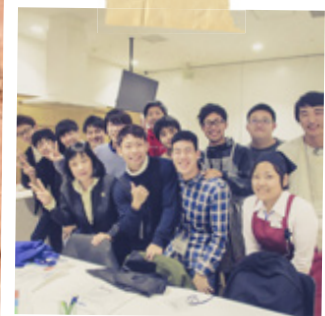
#花田ゼミ #ハグミュージアム #エコクッキング体験 #まりこ飯