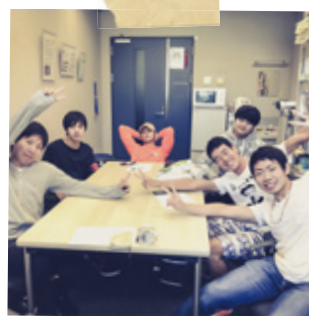
#川田ゼミ #イベント企画 #ポーリング大会