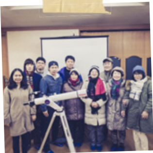
#崎ゼミ #生駒山 #ふたご座流星群 #観測会