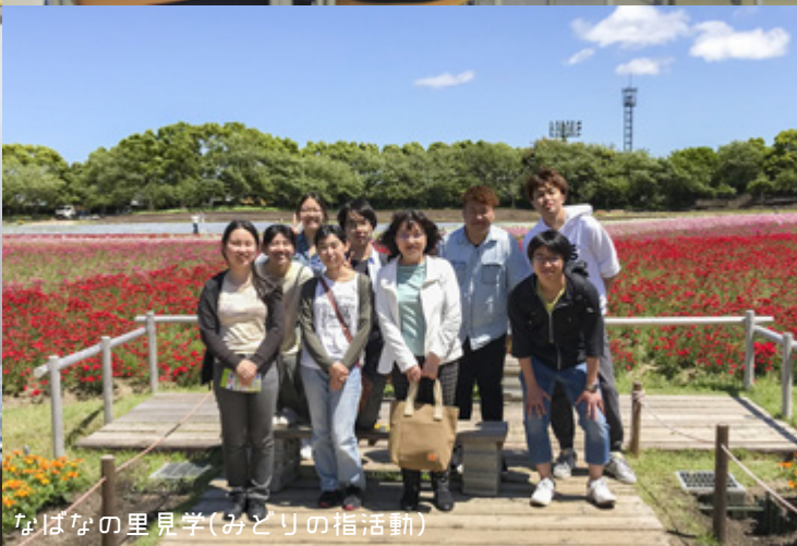
なばなの里見学(みどりの指活動)