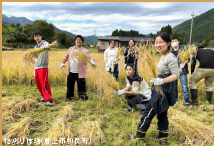
稲刈り体験(郡上市和良町)